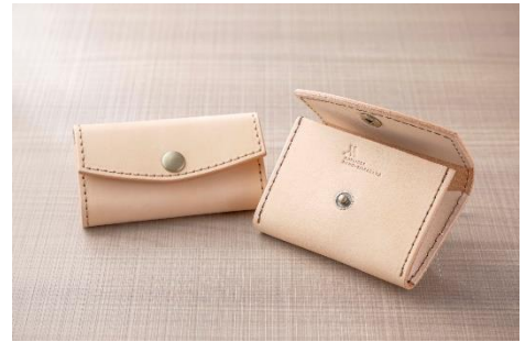
キーケース（左）とコインケース（右） イメージ

地元白浜町でアトリエを構える「 シュエットドール CHOUETTE D'OR」のレザー職人をお招きし、和歌山県産の革細工を使ったキーケースまたはコインケース作りをご体験いただけます。サイズに合わせて切り出した革に、お好みの糸色で手縫いし、ホテルオリジナルの刻印やイニシャルを入れることも可能です。完成した製品は当日お持ち帰りいただけます。長くご愛用いただける和歌山県産の革製品。旅の思い出や大切な人への手作りプレゼントとして、是非この機会にご体験ください。