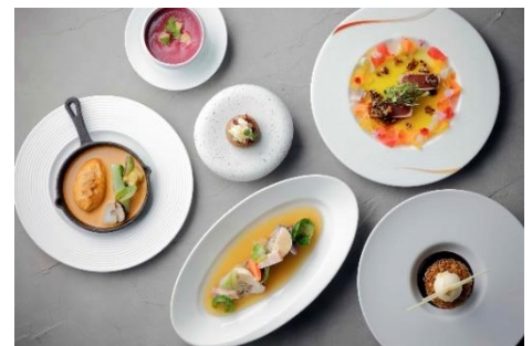
ディナーコース イメージ